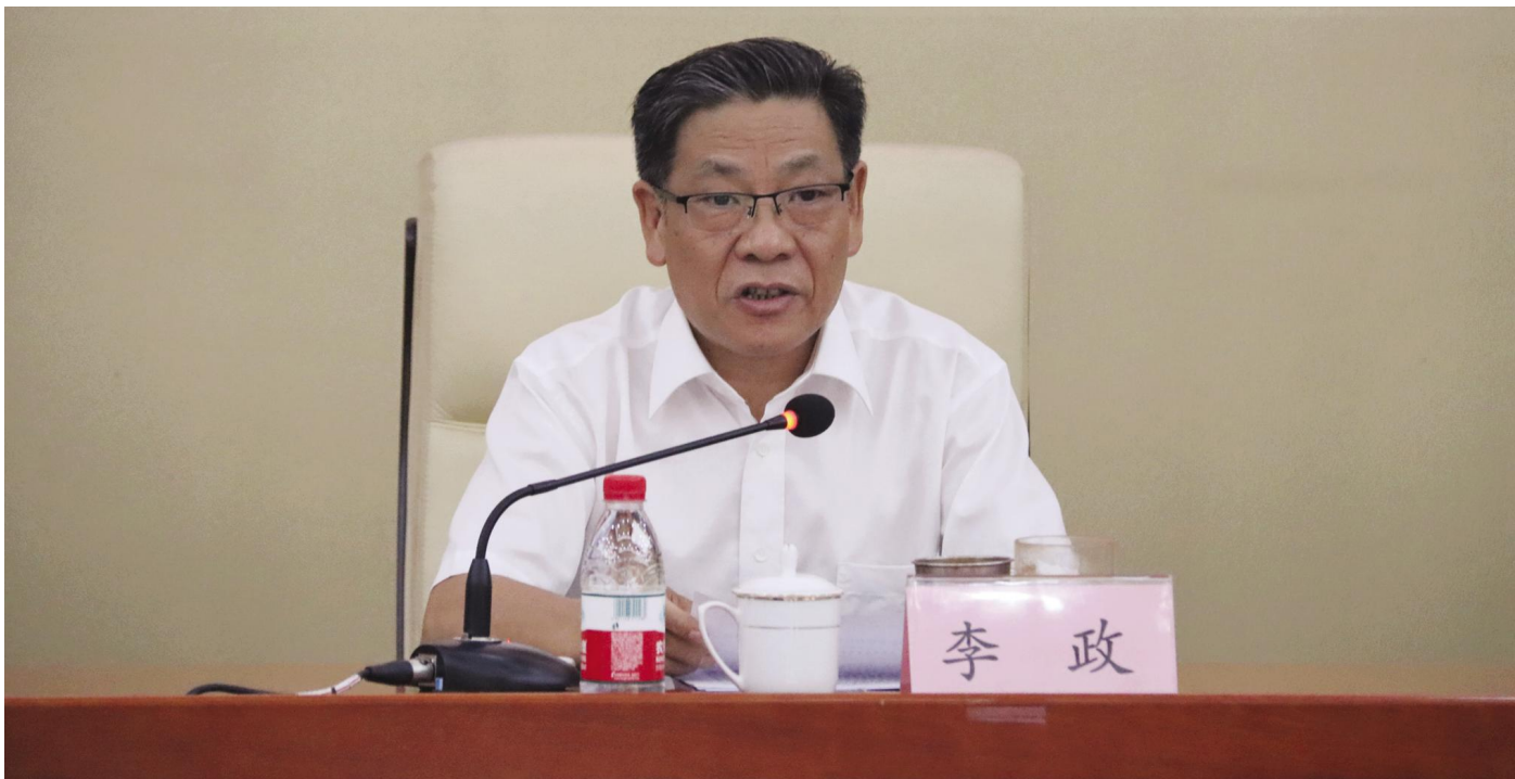
山东省体育局党组书记、局长 省体育总会第四届委员会主席 李 政同志讲话