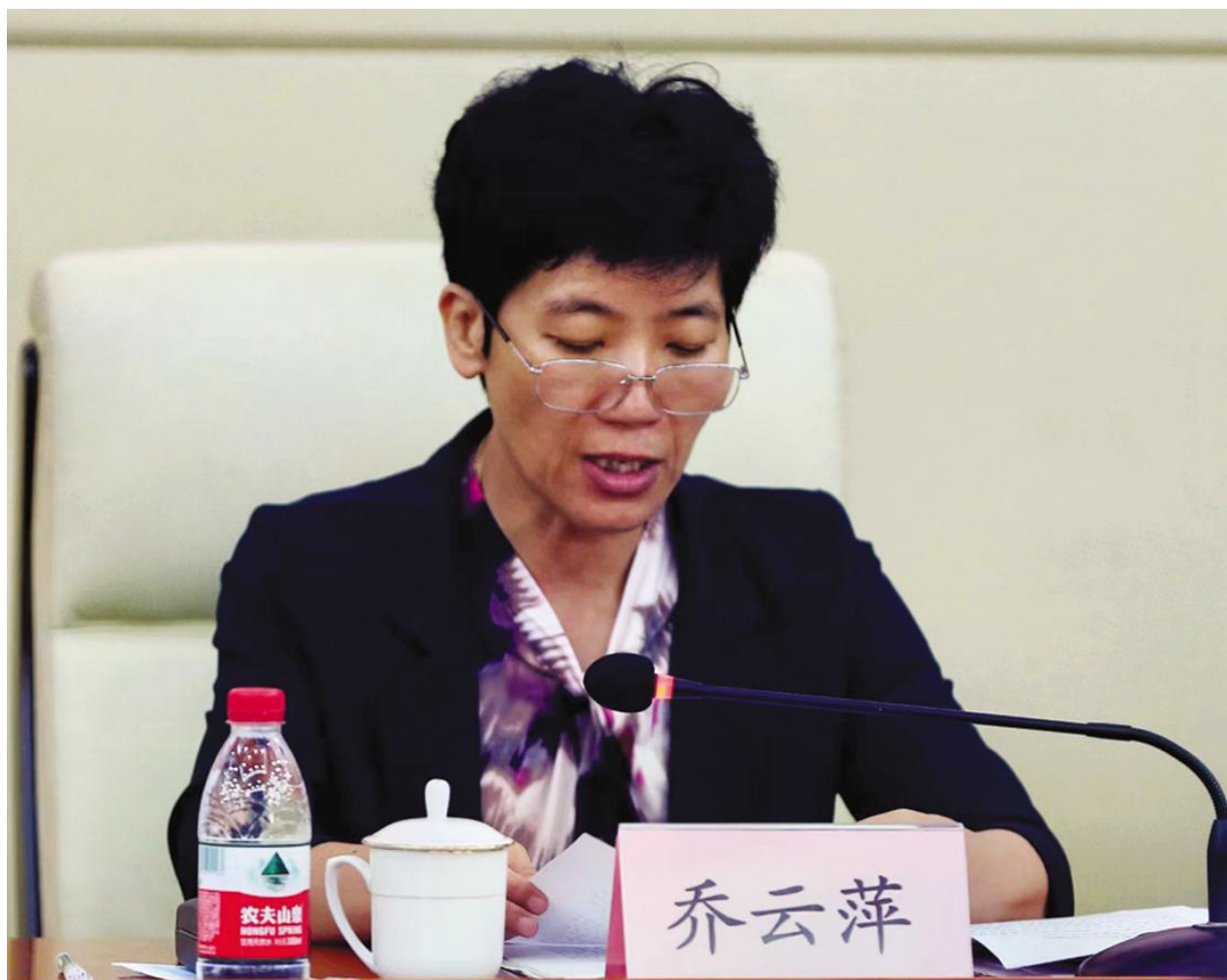
山东省体育局党组副书记 山东省体育总会专职常务副主席 乔云萍同志做工作报告

省体育局党组副书记 省体育总会专职常务副主席 乔云萍 (2022年6月17日通过)