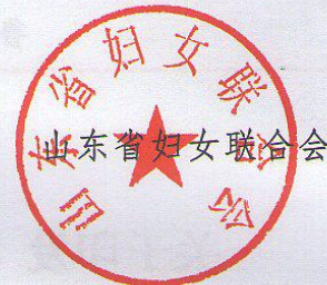
山东省妇女联合会