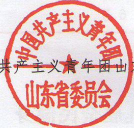
中国共产主义青年团山东省委员会