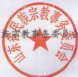
山东省民族宗教事务委员会