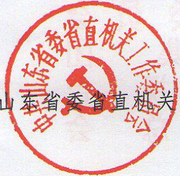
中共山东省委省直机关工作委员会