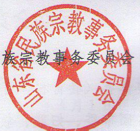
山东省民族宗教事务委员会