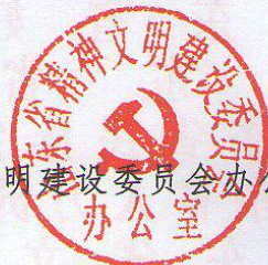
山东省精神文明建设委员会办公室