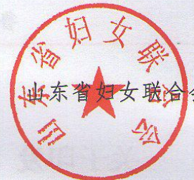
山东省妇女联合会