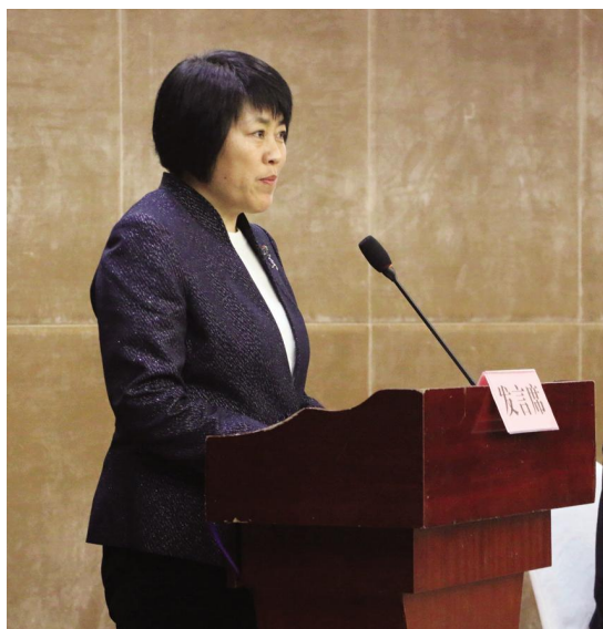
临沂市体育局局长 刘艳芬

近年来，临沂市体育局、体育总会在省体育局、体育总会的指导下，以体育供给侧改革为统领，以基层体育总会全覆盖为重点，